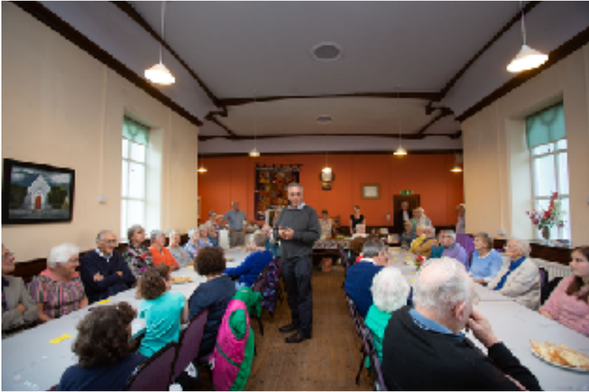
Y Gweinidog yn croesawu