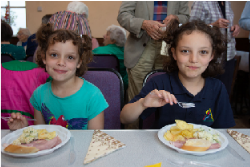
Enid a Mirain yn mwynhau

Hwn oedd y tro cyntaf inni weld Bethlehem ar ei newydd wedd, a diolchwyd i Llŷr James am ei waith cymen yn gosod y gegin newydd yn ei lle.