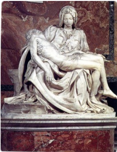
Pietà (1498–9), cerflun gan Michelangelo, yn y Fatican