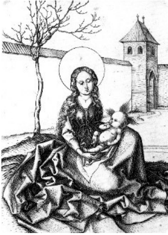
Y Forwyn Fair a'i Phlentyn (15eg ganrif), gan Martin Schongauer, o'r Almaen