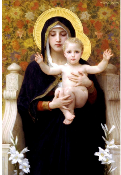
Morwyn y Liliâu (1899), gan William Adolphe Bouguereau