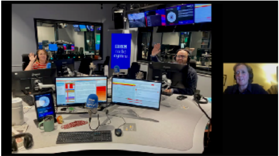
Stiwidio brysur tîm rhaglen Dros Frecwast BBC Radio Cymru