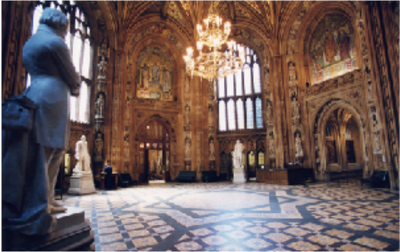
Lobi Tŷ'r Cyffredin (CC BY-NC-ND 2.0)

Os cewch chi gyfle rywdro i ymweld â Thŷ'r Cyffredin yn San Steffan, manteisiwch ar y cyfle! Wrth i chi syllu ar y cerfluniau o bobl bwysig a dylanwadol o'r oesoedd a fu, neu edrych i fyny i syllu ar eiconau o seintiau amrywiol gwledydd Ynysoedd Prydain, fe fyddai'n rhwydd iawn i chi beidio â sylwi ar yr adnod o'r Beibl sydd wedi ei gosod ar lawr y lobi. Yno mewn Lladin gwelir yr adnod: 'Os nad yw'r ARGLWYDD yn adeiladu'r tŷ, y mae ei adeiladwyr yn gweithio'n ofer' (Salm 127:1).