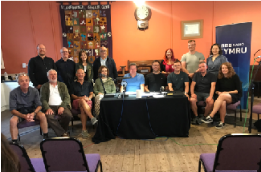
Timau'r Talwrn a Bethlehem dan ei sang