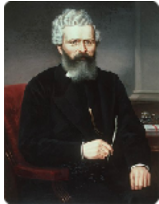
Paentiad gan Evan Williams (Llyfrgell Genedlaethol Cymru)

Bydd rhaglen arbennig yn cael ei pharatoi ar gyfer yr achlysur ac fe fydd ar gael wrth y drws.