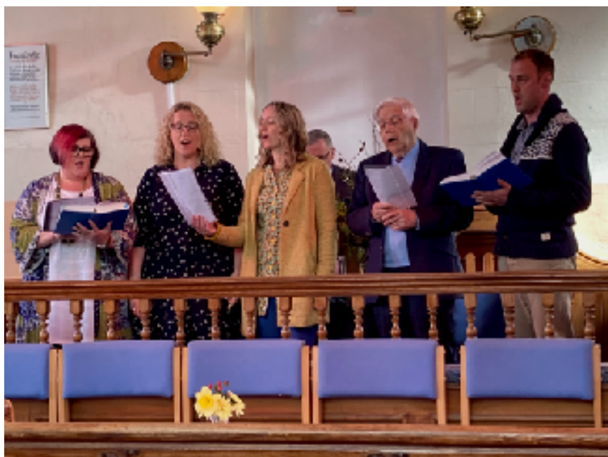
Parti canu Seion