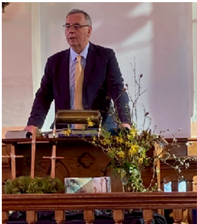
Y Gweinidog yn arwain oedfa'r Grogolith yn Seion