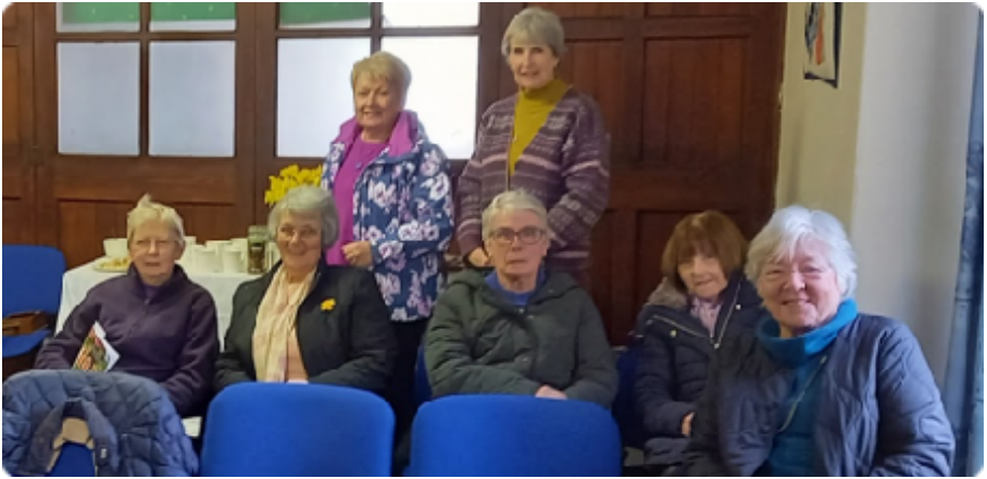
Rhai o'r gynulleidfa yng ngwasanaeth Dydd Gweddi'r Byd a gynhaliwyd ddydd Gwener, 1 Mawrth, yng Nghapel Pen-llwyn ar y cyd ag Eglwys Dewi Sant, Capel Bangor