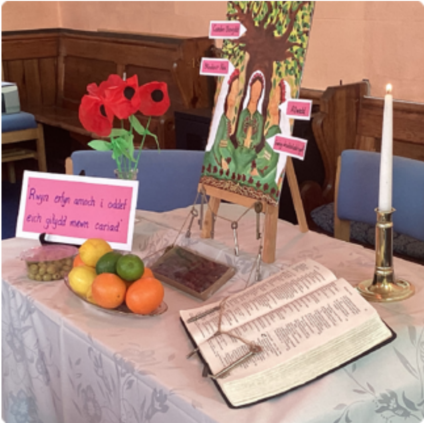
Arddangosfa ar gyfer gwasanaeth Dydd Gweddi'r Byd (uchod) Mwynhau paned a sgwrs cyn dechrau'r gwasanaeth (isod)