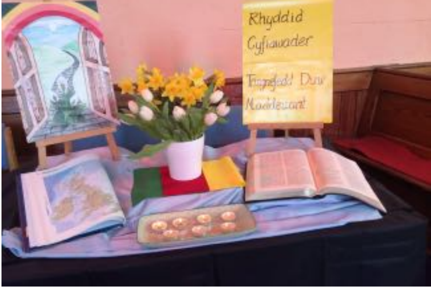
Bwrdd elfennau'r gwasanaeth - a sgwrs felys wedi'r oedfa