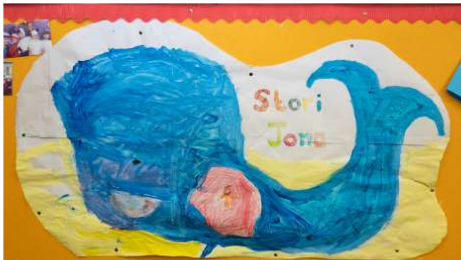
Plant yr ysgol Sul yn mwynhau dysgu stori Jona yn festri'r Garn