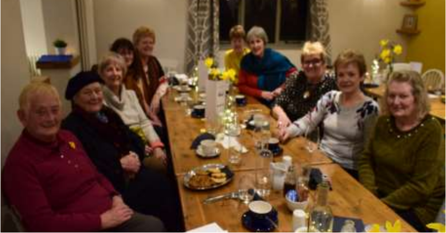
Rhai o'r merched a gymerodd ran yn y gwasanaeth Dydd Gweddi'r Byd yng Nghapel Seion, a bwrdd y wledd 'Dewch—mae popeth yn barod'