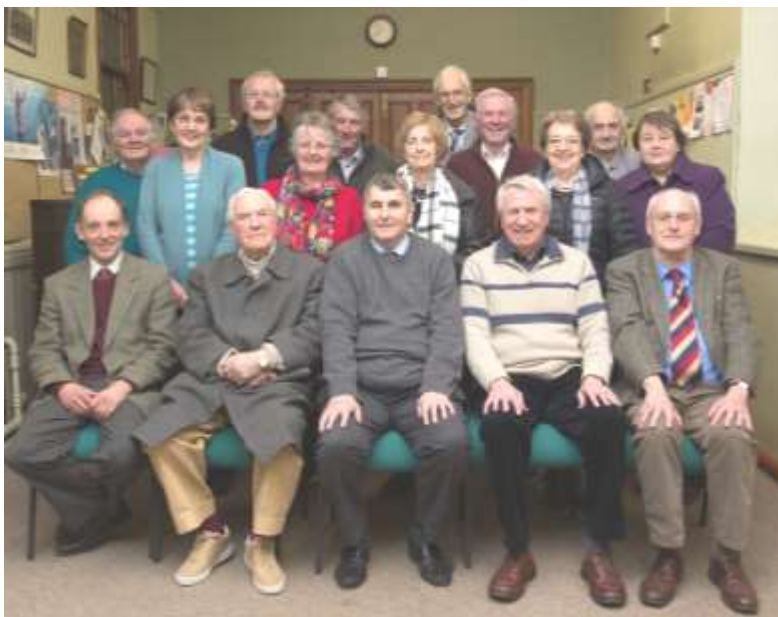
Pwyllgor Swyddogion yr Ofalaeth, Chwefror 2017

Ysgrifennydd Pwyllgor Swyddogion yr Ofalaeth