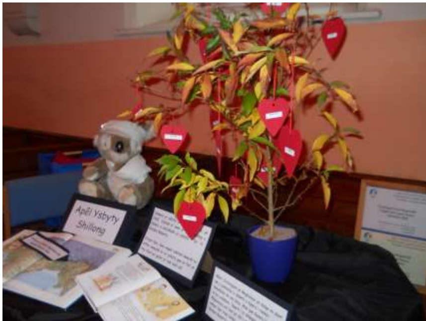
Apêl Ysbyty Dr Gordon Roberts, Shillong