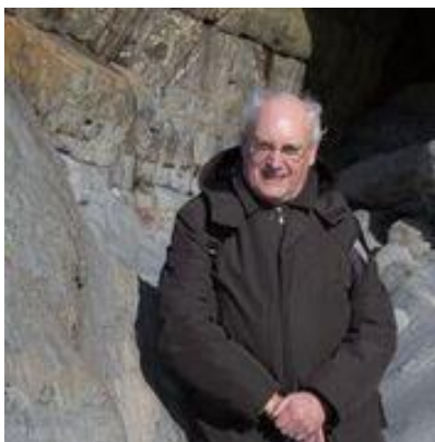
Yr awdur ger ogof Owain Glyndŵr yn Nhonfannau