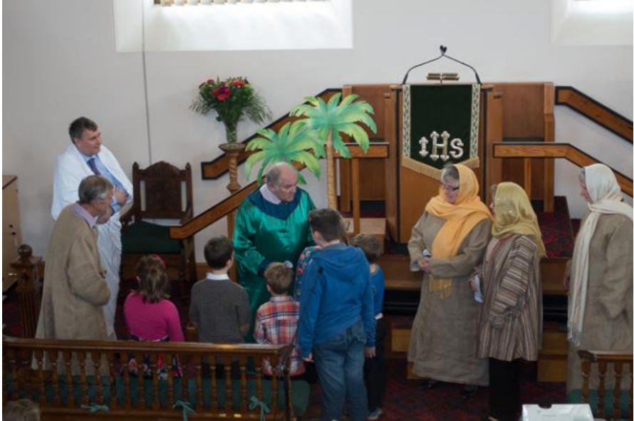
Cyflwyno stori Sacheus