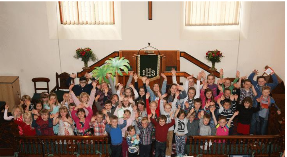
Plant ysgolion Sul Gogledd Ceredigion yn mwynhau eu hunain yn y Gymanfa