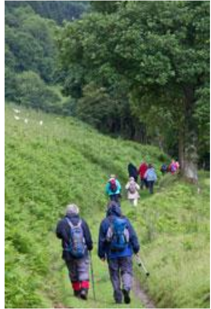
Y cerddwyr ar eu taith