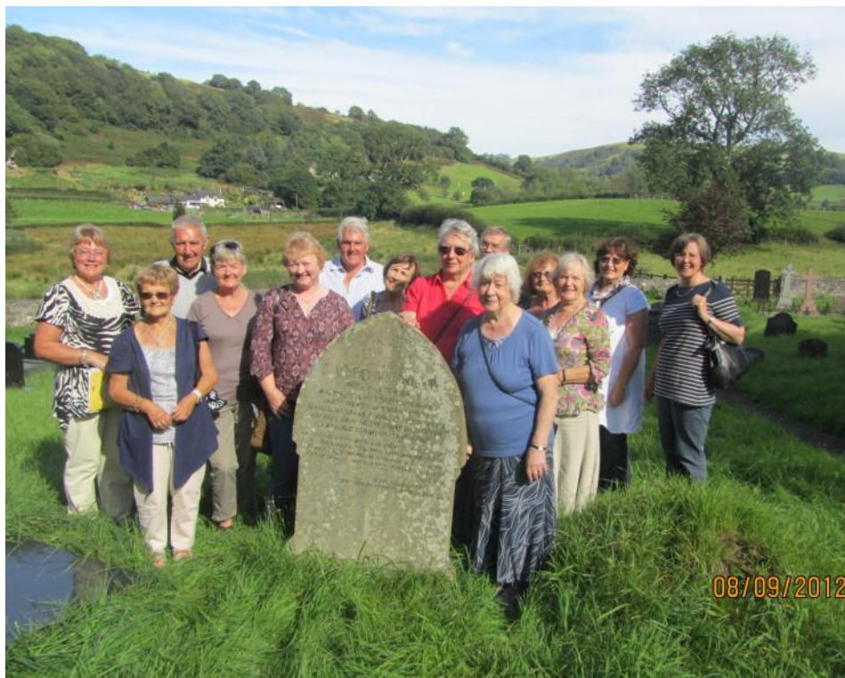
Aelodau Rehoboth ger bedd 'honedig' Dafydd ap Gwilym yn Nhalylychau