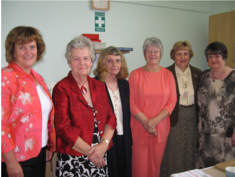
Y chwirydd a fu'n paratoi'r cinio Bara a Chaws

Codwyd y swm o £218 yn dilyn cinio Bara a Chaws ar ôl yr oedfa fore Sul, 20 Mai, er budd Cymorth Cristnogol. Yn ychwanegol at hynny derbyniwyd £196, sef swm casgliad y gwasanaeth undebol, ac felly trosglwyddwyd £414 i drefnydd lleol Cymorth Cristnogol.