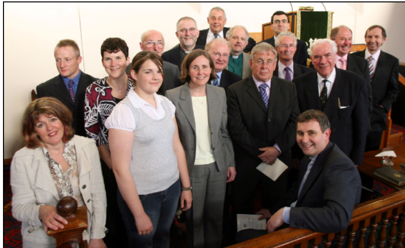
Nifer o'r rhai a gymerodd ran yn y Gwasanaeth Sefydlu

Mae'r seiliau wedi gosod. Nawr awn ymlaen i drefnu ar gyfer y flwyddyn nesaf a chynhelir cyfarfod o'r Gweithgor yn fuan. Dewch i gefnogi'r fenter.