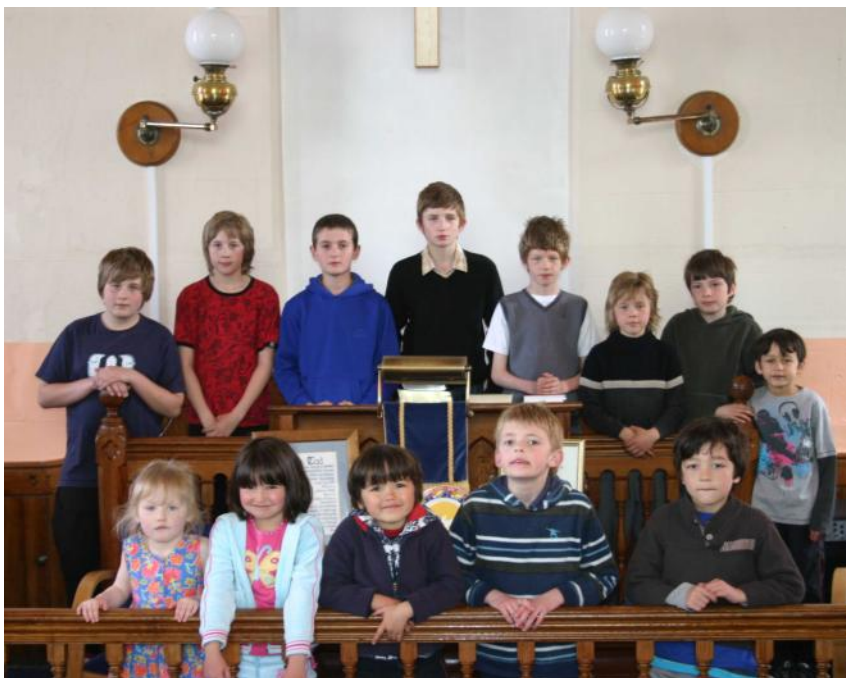
Ysgol Sul Capel Seion